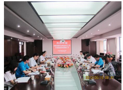
（上图为市教委对我院食品安全检查会议图片）

索证索票、食品留样、添加剂、“6T”实务管理、内部管理制度落实情况等。最后检查组对此次检查情况进行了反馈，充分肯定了我院在食品安全工作上所做的努力和取得的成效，并提出了宝贵的建议。