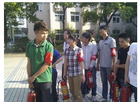
（上图为志愿者参加灭火器培训图片）

● 平安校园志愿者服务队圆满完成本学期校园安全值守工作。一学期来，志愿者服务队共执勤服务84天，总人次达252人次。在校园里他们为师生的出行安全保驾护航，为提倡安全饮食发放宣传单、横幅签字，参与在每一次的消防培训、演练中。此外，积极开展了安全检查、安全宣传等一系列丰富多彩的志愿者活动，活动的同时不仅增加了志愿者们们的安全知识，加强了队伍的凝聚力，也为构建和谐、安全的校园做出了积极的贡献，维护了校园的安全稳定。