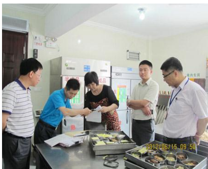
（上图为检查组实地检查图片）

● 6月中旬，市教委高校食品安全专项检查组来我院检查食品安全，并对我院学生食堂、加工区、厨房区、仓储区、惨剧清洗间等进行了实地检查。听取汇报后，检查组重点检查了